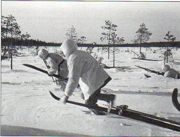
Атакуют финские лыжники.