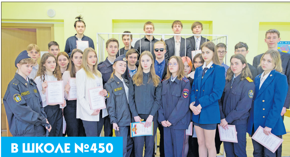
В ШКОЛЕ №450

С учащимися проводились беседы правовой направленности, в которых затрагивались важные вопросы по предупреждению правонарушений. В течение нескольких недель про-