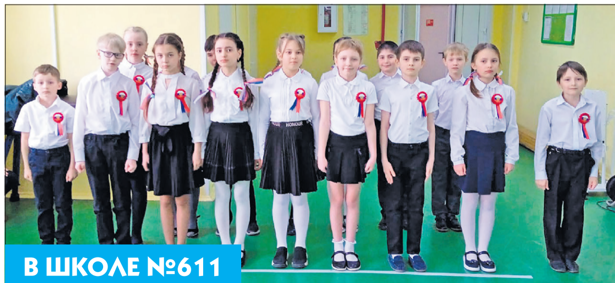
В ШКОЛЕ №611

28 апреля в нашей школе впервые состоялся смотр-конкурс строя и песни, посвящённый 77-летию Победы в Великой Отечественной войне, в котором принимали участие учащиеся 1-4 классов.