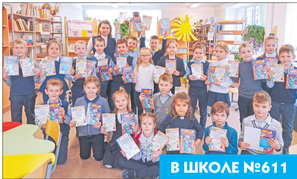
В ШКОЛЕ №611

ПОДВЕДЕНЫ ИТОГИ ГОРОДСКОГО КОНКУРСА «ШКОЛА ЗДОРОВЬЯ САНКТ-ПЕТЕРБУРГА» В конкурсной номинации «Общеобразовательные учреждения» приняли участие 19 образовательных организаций из 15 районов Санкт-Петербурга. ПО ИТОГАМ КОНКУРСА ГБОУ НОШ № 611 СПБ ЗАНЯЛА 3 МЕСТО В САНКТ-ПЕТЕРБУРГЕ.