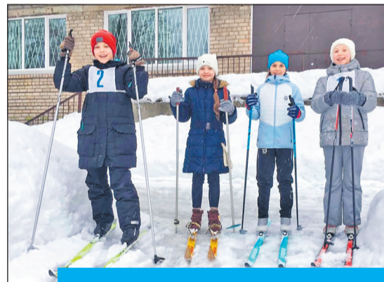
В ШКОЛЕ №611