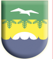
ГРАФИК ПРИЕМА ГРАЖДАН В ФЕВРАЛЕ 2022 ГОДА

Заместитель главы муниципального образования города Зеленогорск