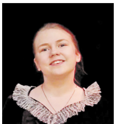
Победитель районного конкурса чтецов «Разукрасим мир стихами»