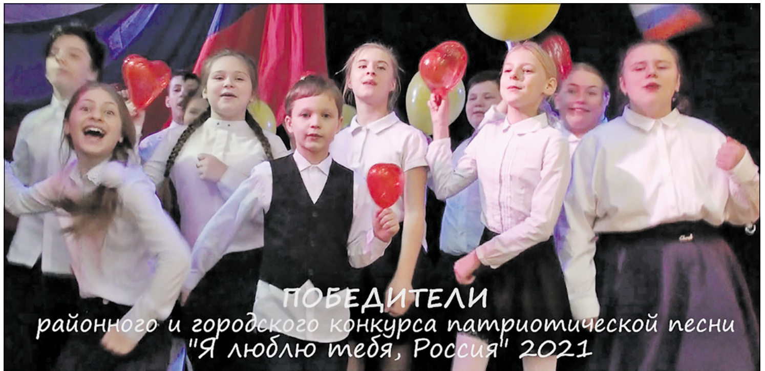
ПОБЕДИТЕЛИ районного и городского конкурса патриотической песни "Я люблю тебя, Россия" 2021