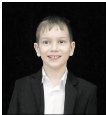
Победитель городского театрального конкурса «Образ – 2021» в номинации чтецы