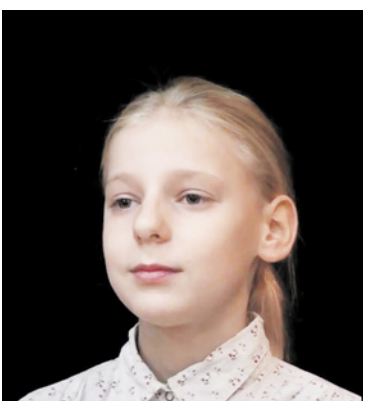
Победитель районного конкурса чтецов «Разукрасим мир стихами»