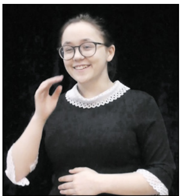
Лауреат городского театрального конкурса «Образ – 2021» в номинации чтецы