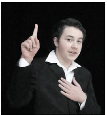
Лауреат городского театрального конкурса «Образ – 2021» в номинации чтецы