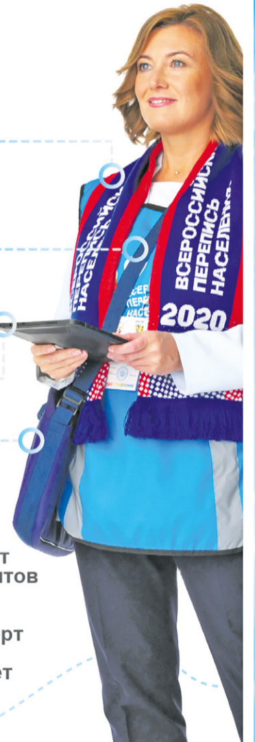
ГРАФИК РАБОТЫ И АДРЕСА СТАЦИОНАРНЫХ ПЕРЕПИСНЫХ УЧАСТКОВ В ЗЕЛЕНОГОРСКЕ

МФЦ по Курортному району (пр.Ленина, д.21, лит.А).