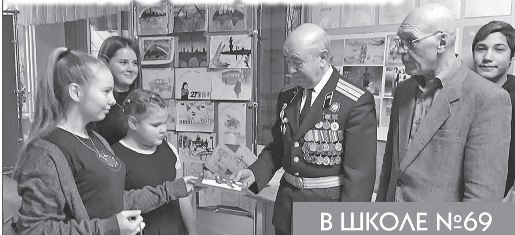
В ШКОЛЕ №69