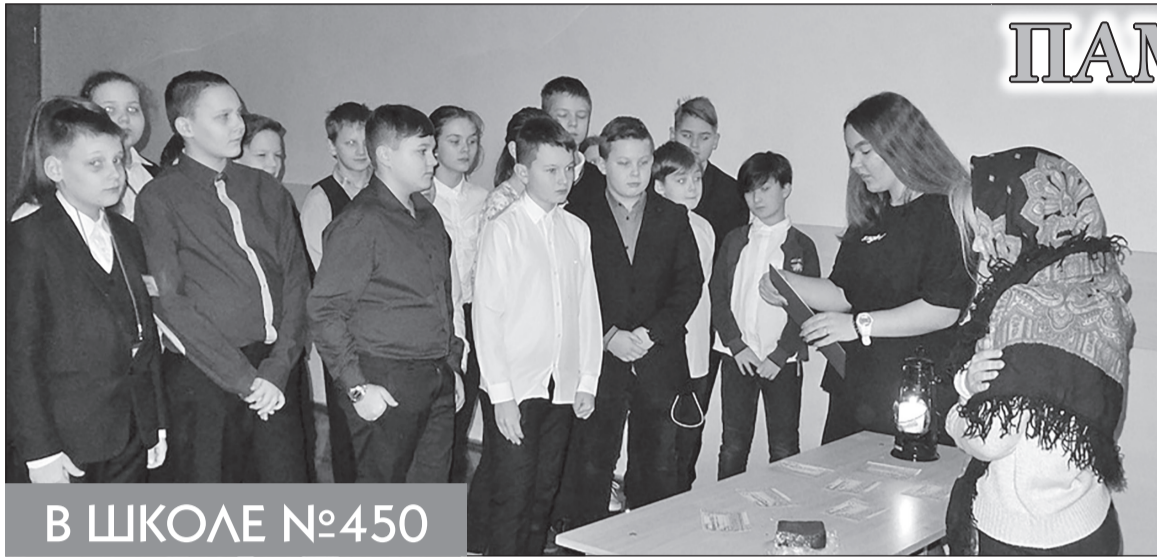
В ШКОЛЕ №450