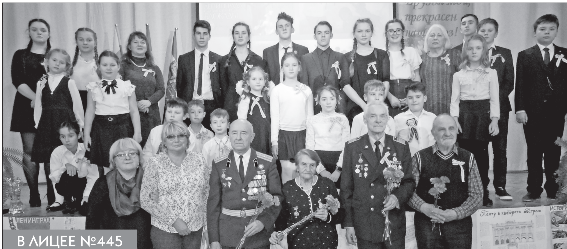
В ЛИЦЕЕ №445