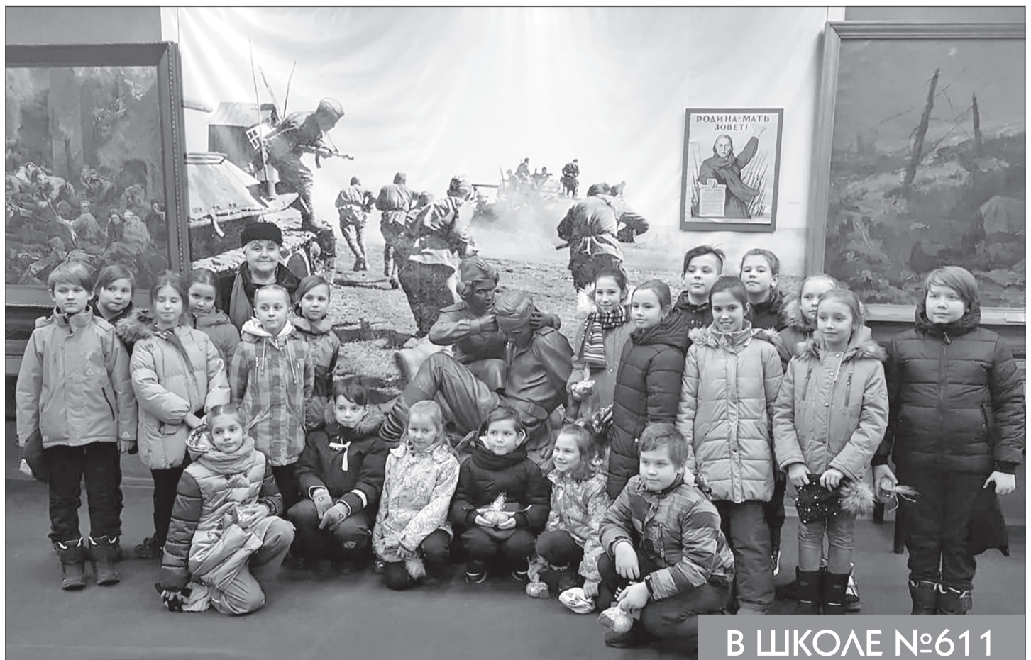
В ШКОЛЕ №611