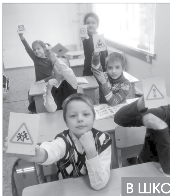
В ШКОЛЕ 611