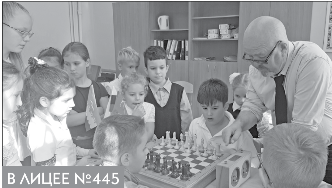
В ЛИЦЕЕ №445