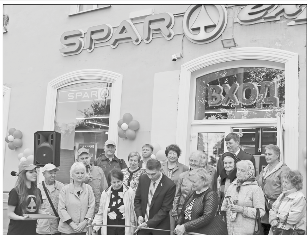
21 сентября в Зеленогорске, на Вокзальной улице, 9 состоялось торжественное открытие супермаркета SPAR express