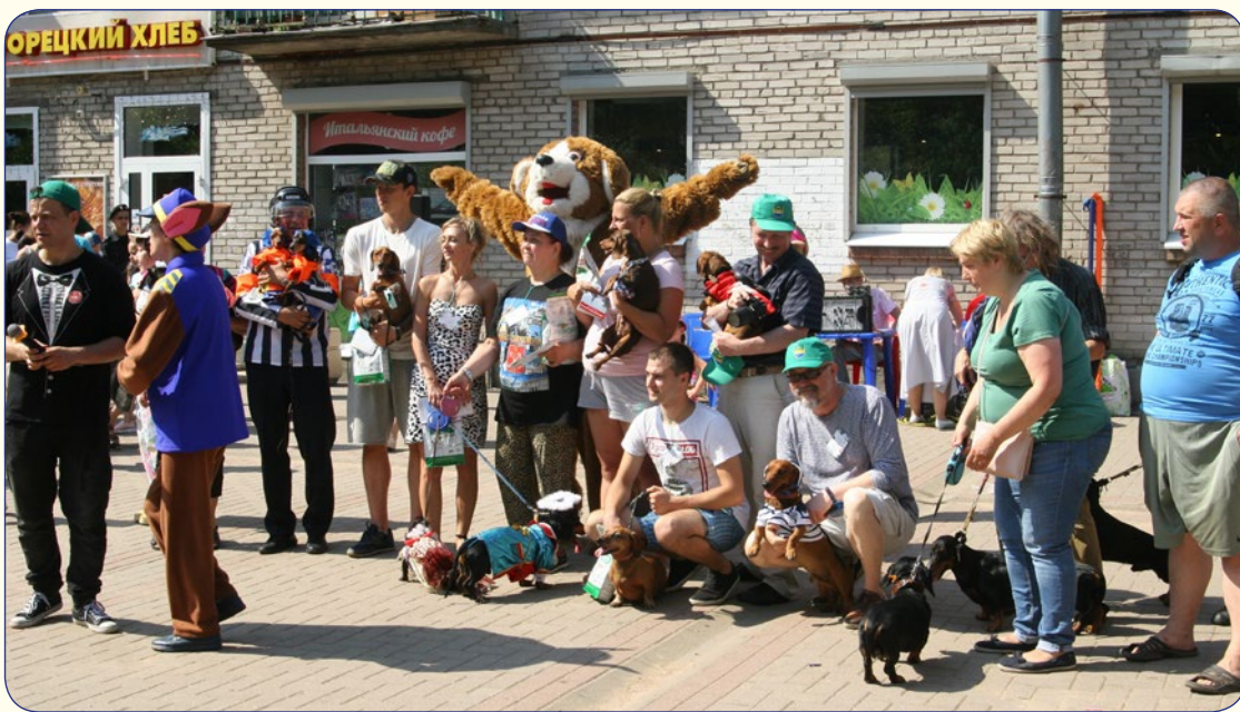
По традиции, у дома №24а по проспекту Ленина прошел ежегодный парад такс – «14-я зеленогорская Таксовка».