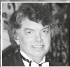
Народный артист России Сергей Захаров