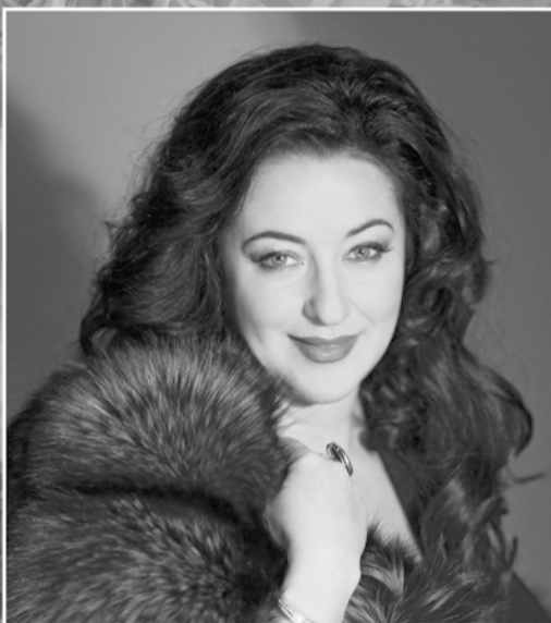
Народная артистка России Тамара Гвердцители

праздничный фейерверк 22.00 пр. Ленина, 2, площадь перед лицеем