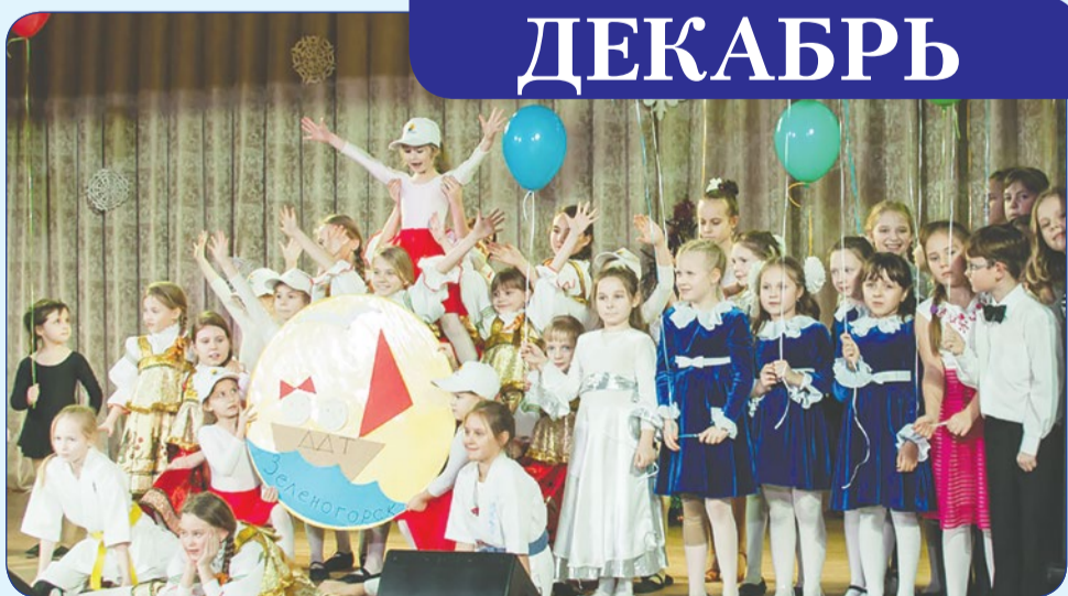
В декабре Зеленогорский дом творчества отпраздновал 70-летие