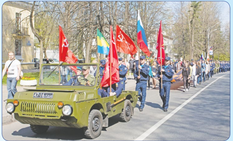
9 Мая торжественным маршем прошли жители нашего города до Зеленогорского Мемориала. В колонне «Бессмертного полка» шло более 300 зеленогорцев.