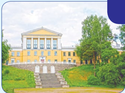
15 октября наш лицей отпраздновал свой 65-й день рождения

14 октября в Зеленогорске воссияла еще одна духовная жемчужина – епископ Царскосельский Маркел совершил чин освящения храма Покрова Пресвятой Богородицы, расположенного на территории ПНИ №1.