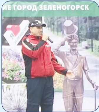
9 октября на площадке у дома 7 по Привокзальной улице Муниципальный Совет и Местная администрация Зеленогорска провели праздник двора