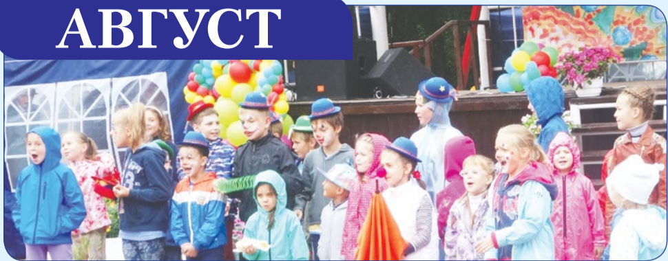
13 августа Зеленогорский парк культуры и отдыха отметил свой 61-й день рождения