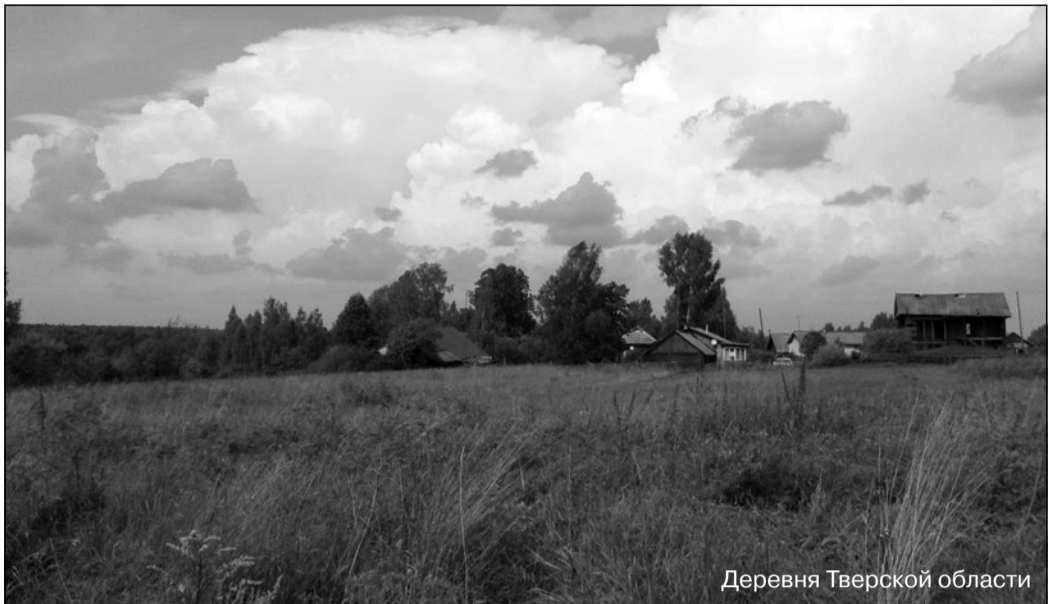
Деревня Тверской области