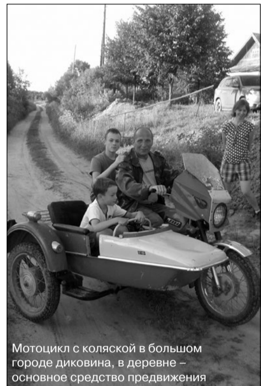
Мотоцикл с коляской в большом городе диковина, в деревне – основное средство передвижения