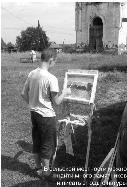
В сельской местности можно найти много памятников и писать этюды с натуры