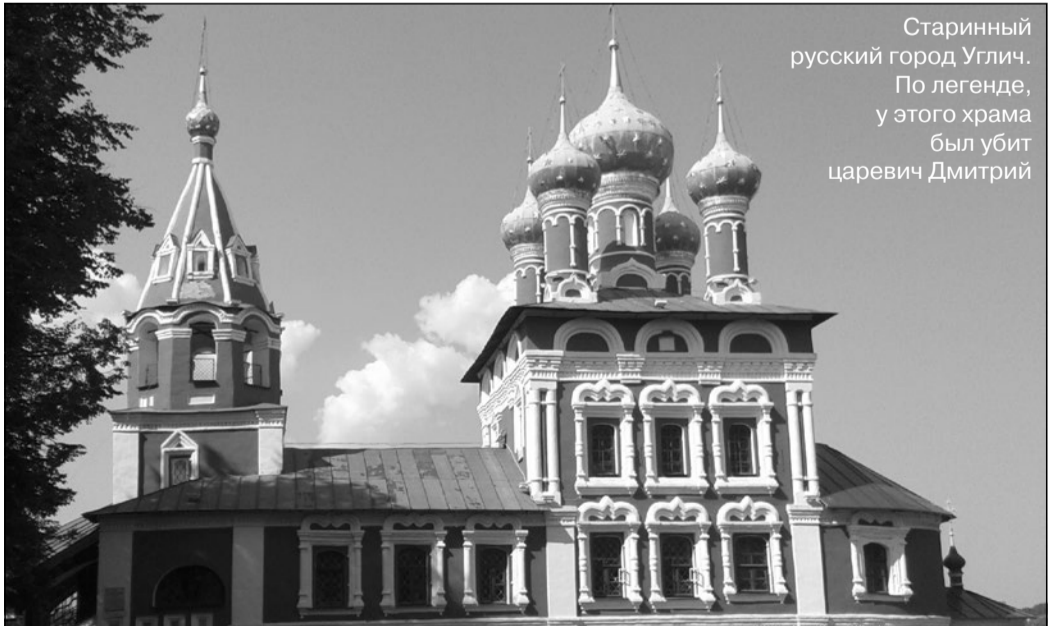
Старинный русский город Углич. По легенде, у этого храма был убит царевич Дмитрий