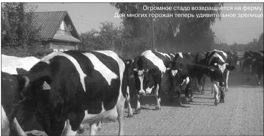
Огромное стадо возвращается на ферму. Для многих горожан теперь удивительное зрелище