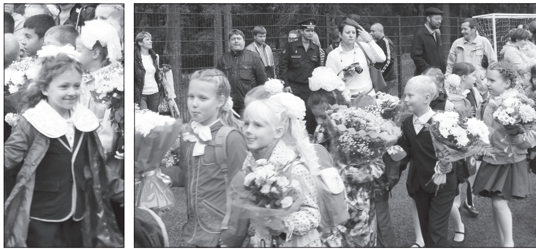
1 сентября во всех школах Зеленогорска прошли торжественные линейки, посвященные началу нового учебного года.