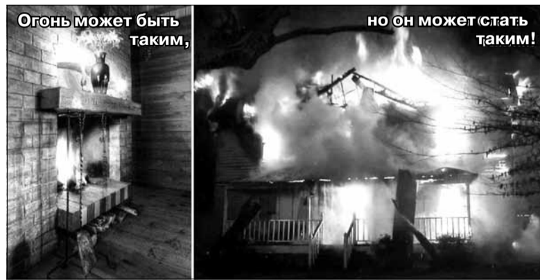
Огонь может быть таким,

Территориальный отдел по Курортному району УГЗ ГУ МЧС России по Санкт-Петербургу