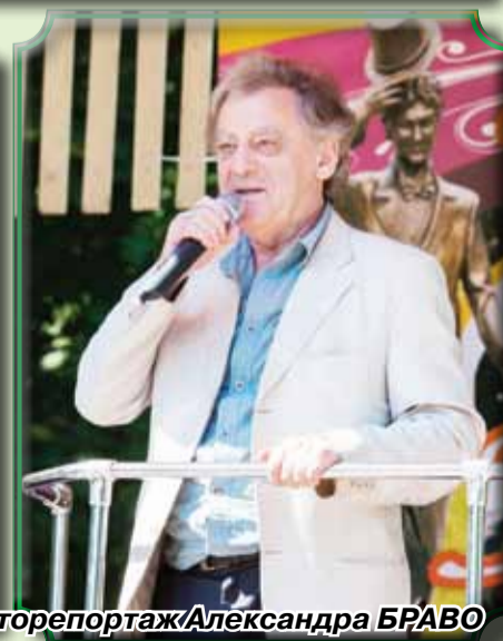
Фоторепортаж Александра БРАВО