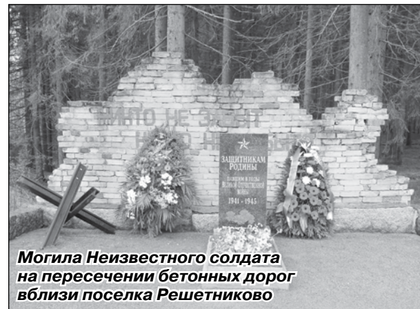
Могила Неизвестного солдата на пересечении бетонных дорог вблизи поселка Решетниково