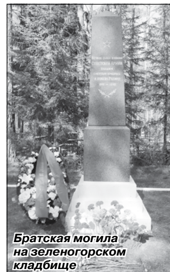
Братская могила на зеленогорском кладбище