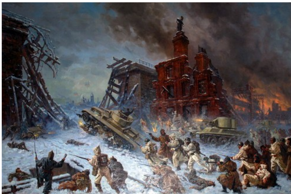
П. Соколов-Скаля "Штурм Выборга", 1940 г.

Завершить в полном объеме все намеченные мероприятия по увековечиванию истории и событий советско-финляндской войны 1939/1940 гг. помешала Великая Отечественная война, заслонившая собой так называемую “зимнюю войну”. В послевоенные годы тема конфликта между СССР и Финляндией перестала быть актуальной и не нашла отражения в отечественной историографии. К сожалению, судьба большинства музейных экспонатов, предметов изобразительного искусства, трофеев, макетов книг и многого другого осталась неизвестной.